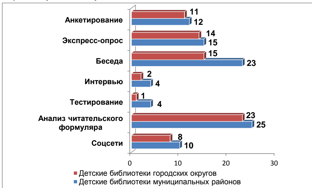
Рисунок 3. Методы, применяемые детскими библиотеками Челябинской области в своих исследованиях

Следует учитывать, что анализ читательских формуляров это метод, который используется фактически только в библиотечной сфере и ценный источник информации о частоте посещения деткой библиотеки, жанровых литературных предпочтениях, востребованности периодики, самых читающих семьях и т.д. На основании ежегодных отчетов детских библиотек наблюдается тенденция